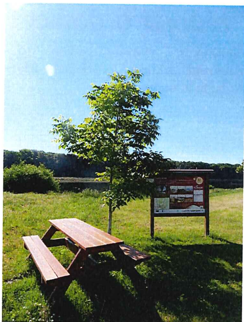
Jedno z deseti odpočivných míst se nachází v obci Kyškovice na pravém břehu řeky Labe.