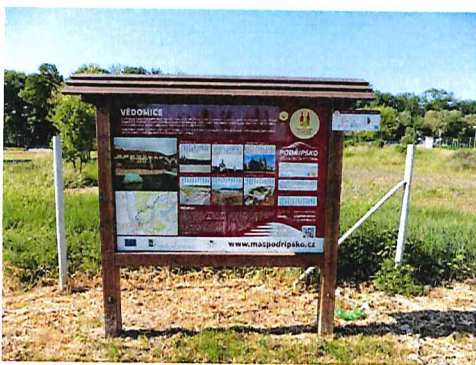
Podél Polabské stezky se na 12 informačních tabulích dozvíte o zajímavostech okolí.